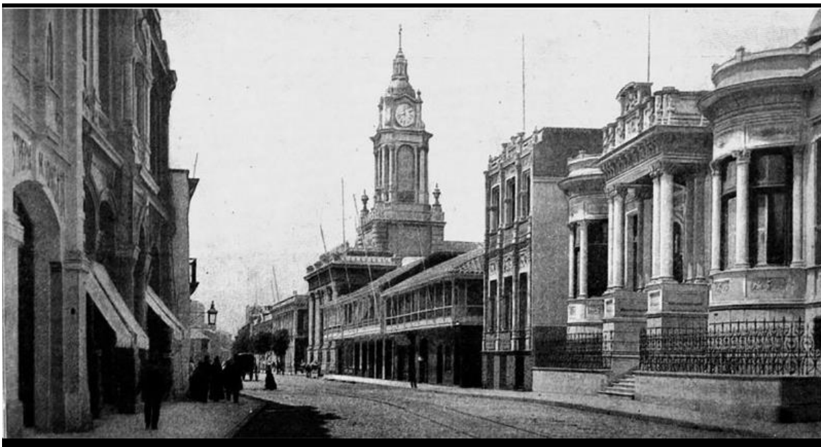
Vista general de calle Condell, desde casa habitación de la familia Lyon. Se identifican calle Huito, Molina y la iglesia Espíritu Santo. 5

la universal tirana de la época para alimentar al monstruo moderno que se llama lujo” 4 .