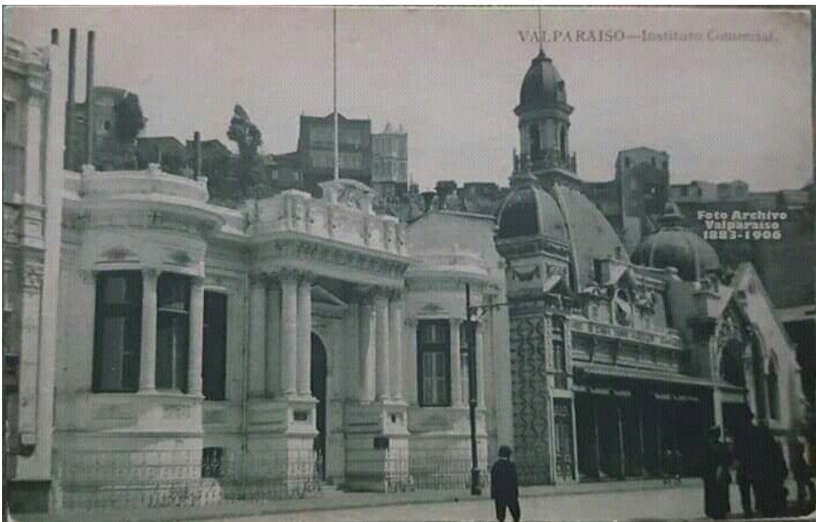
7 Palacio Lyon calle Condell