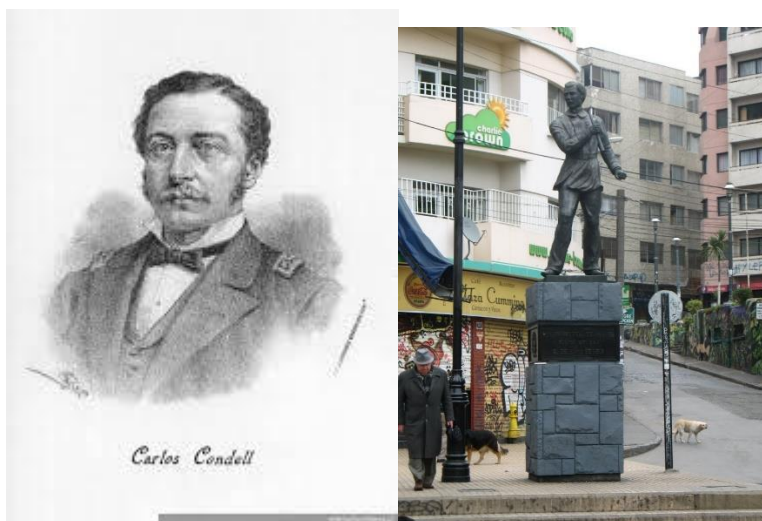
Carlos Condell y su monumento en plaza Aníbal Pinto

El historiador Rodolfo Urbina nos describe el desarrollo comercial y urbano de la calle Condell y nos dice: “...así como Condell ( y calle Esmeralda ), cambiaron tanto su fisonomía llegando a ser verdaderamente hermosas por sus nuevos edificios, y cálidas, por la clase de comercio que ofrecían, más que Prat que se mostraba fría y ajena.” Nos sigue indicando que se construía, se destruía y se volvía a construir, en su relato nos indica que el Palacio Lyon fue una de esas obras magníficas que vino a aristocratizar la esquina de Condell con Huito en los años ochenta ( del siglo XIX ). 3 Según el Historiador Urbina tanto la calle Esmeralda como calle Condell concentraban lo más hermoso del desarrollo urbano de la ciudad puerto, y testimoniaban el progreso económico que había alcanzado la ciudad con sus edificios, con sus tiendas y con su “alto comercio” en estas calles.